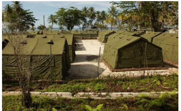
Het Australische detentiecentrum op Manuseiland in 2012.

Vluchtelingen die Australië proberen te bereiken, worden buiten de wereld van mensenrechten geduwd. Australië plaatst hen voor onbepaalde duur in detentie, zonder juridische monitoring of vertegenwoordiging. In de periode waarin Boochani op Manuseiland verbleef, riskeerden dokters of sociale werkers die getuigden over misdaden in deze detentiecentra, tot 2 jaar cel . Mensen op de vlucht worden zo zowel ruimtelijk als symbolisch buiten de samenleving geplaatst, in een grijze zone die tal van mensenrechtenschendingen in de hand werkt: het recht op vrijheid van beweging, op bescherming, op privacy, op de integriteit van het gezinsleven enz.