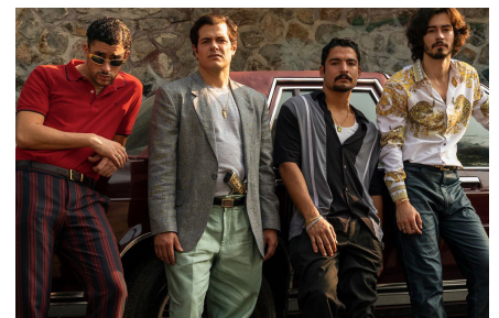
Narcos Mexico .

Geweld in Mexico wordt in de westerse media en cultuur voornamelijk op stereotiepe wijze gepresenteerd: er wordt gefocust op drugshandel en corruptie (denk maar aan series zoals Narcos Mexico en Breaking Bad ) en de nadruk ligt op een strijd tussen goed en kwaad. Melchor slaagt er in Orkaanseizoen echter in om dat simplistische clichébeeld niet te reproduceren maar net de complexiteit van de gebeurtenissen in Mexico aan te tonen en zo de lezer te dwingen tot reflectie.